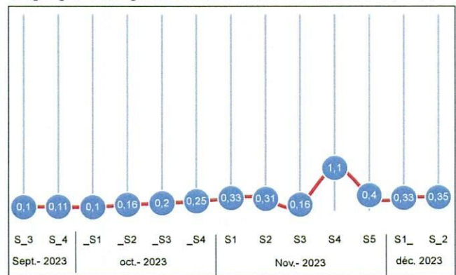
Graphique 2. Comportement de l'inflation hebdomadaire (en %)